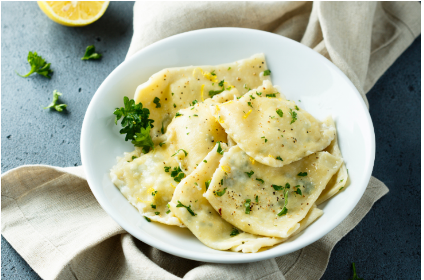
Ravioli di Razza.

questa preparazione che vede questo pesce racchiuso nei lembi di due ravioli: