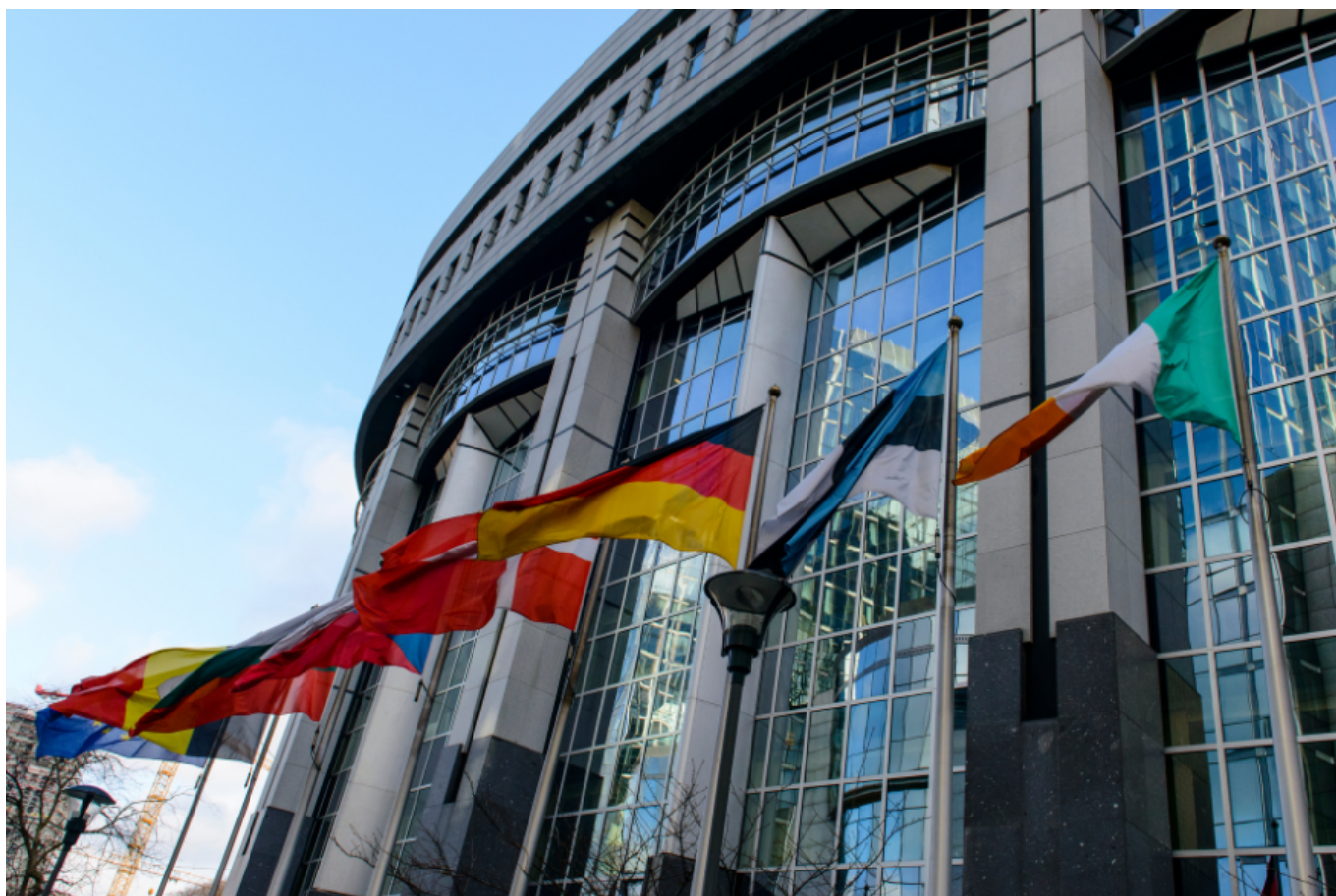
Bandiere sventolano fuori dalla Commissione Europea.