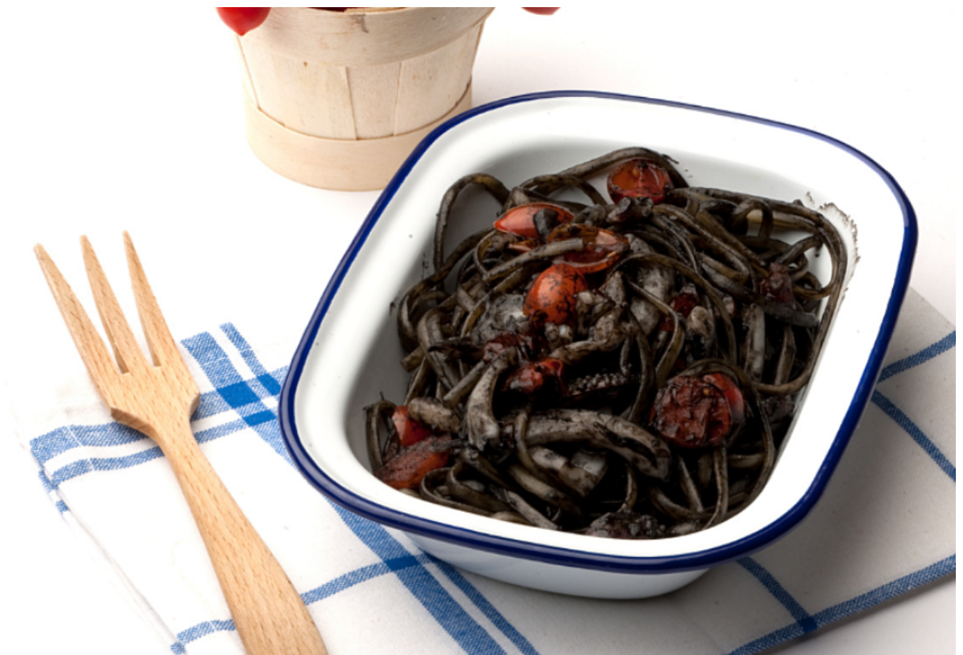
Pasta al nero di Seppia

Se vuoi assaggiare un piatto di pesce a base di Seppia dal ricettario Hello Fish! , prova la più classica e intramontabile delle ricette a base di questo mollusco: