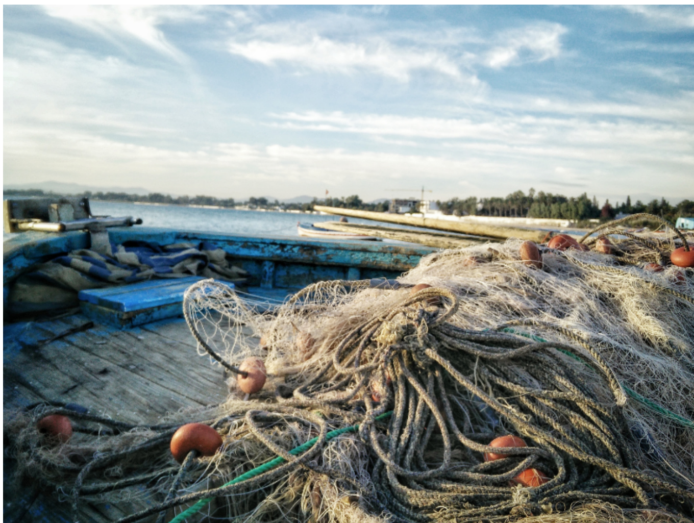
Alcune reti della piccola pesca artigianale.