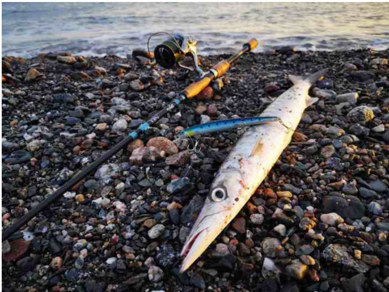
Luccio di Mare appena pescato da riva con lenza.

dell'anno, in particolare da gennaio a luglio, quando è comunque disponibile ed è fuori dal periodo di riproduzione.