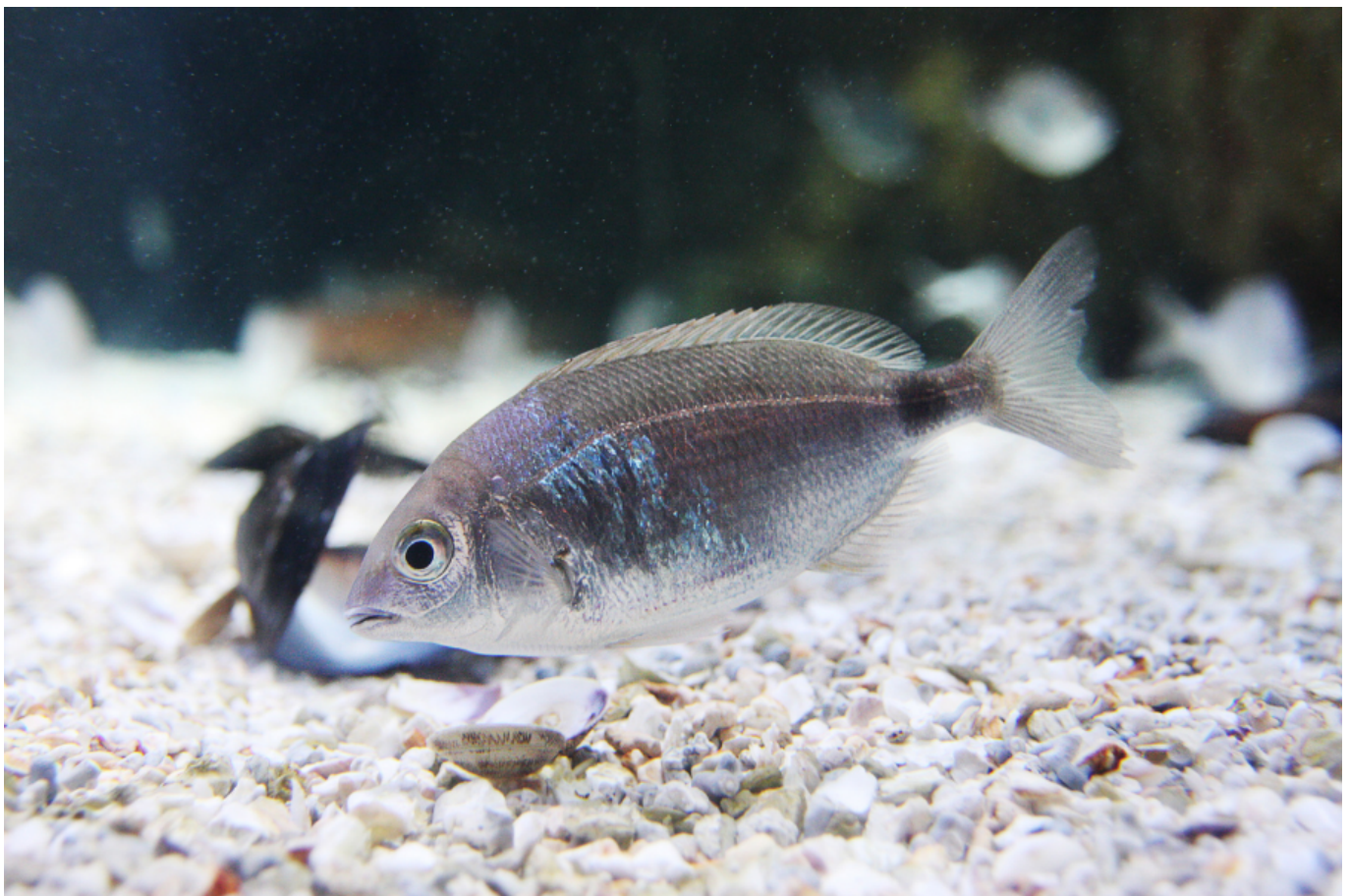
Occhiata di taglia piccola.

Riguardo al rischio specie, l'IUCN (Unione Mondiale per la Conservazione della Natura) dichiara che la specie non è soggetta a rischi imminenti, sia per la sua presunta distribuzione, sia perché non vi sarebbero evidenze di declino o minacce specifiche ( guida all'acquisto dell'Occhiata ).